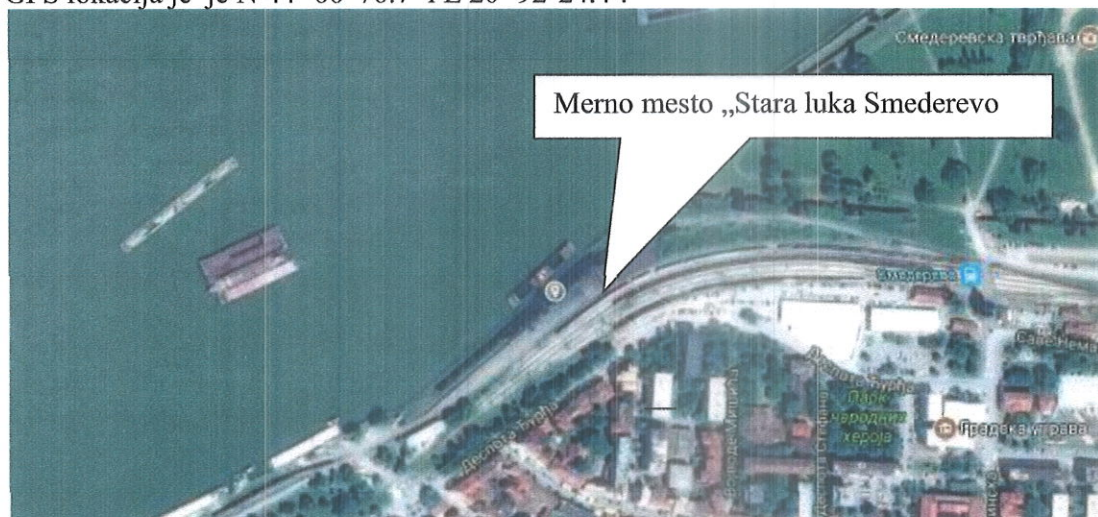
Slika 1. Lokacija makrolokacije mernog mesta „Stara luka Smederevo”

Makrolokacija mernog mesta: “Stara luka Smederevo” se nalazi na obali reke Dunav na severnom delu opštine Smederevo. Luka je sa južne strane okružena individualnim stambenim i poslovnim objektima. Sa severne strane okružena je rekom Dunav, zapadno od postrojenja nalazi se pristanište a severo istočno od postrojenja nalazi se spomenik kulture Smederevska tvrđava. Kroz luku prolazi železnička pruga. Lokacija mernog mesta “Stara luka Smederevo” data je na sledećem satelitskom snimku a njena GPS lokacija je je N 44° 66' 76.7" i E 20° 92' 24.4“.